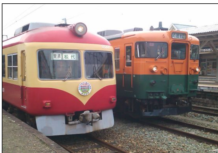
屋代駅で並ぶ2000系（左）と169系（右）

乗客の減少等を理由に2012年3月31日をもって運行を終了し、路線廃止が決定されている路線ですが、昔ながらの風情ある駅舎や、長閑な田園風景の中を走る姿を惜しむ声も多い。