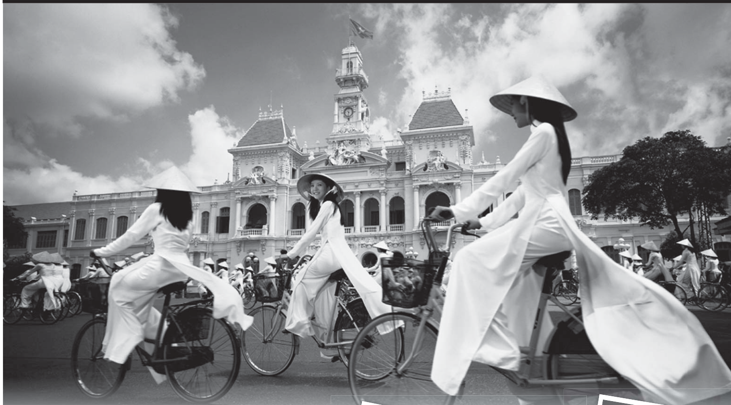
ベトナム ホーチミン市庁舎前/イメージ

旅行代金には燃油サーチャージが含まれております。燃油サーチャージは変更・廃止されることがありますが、それによる旅行代金の変更はいたしません。国内空港施設使用料・旅客保安サービス料(成田発のみ)及び現地空港諸税は別途必要です。