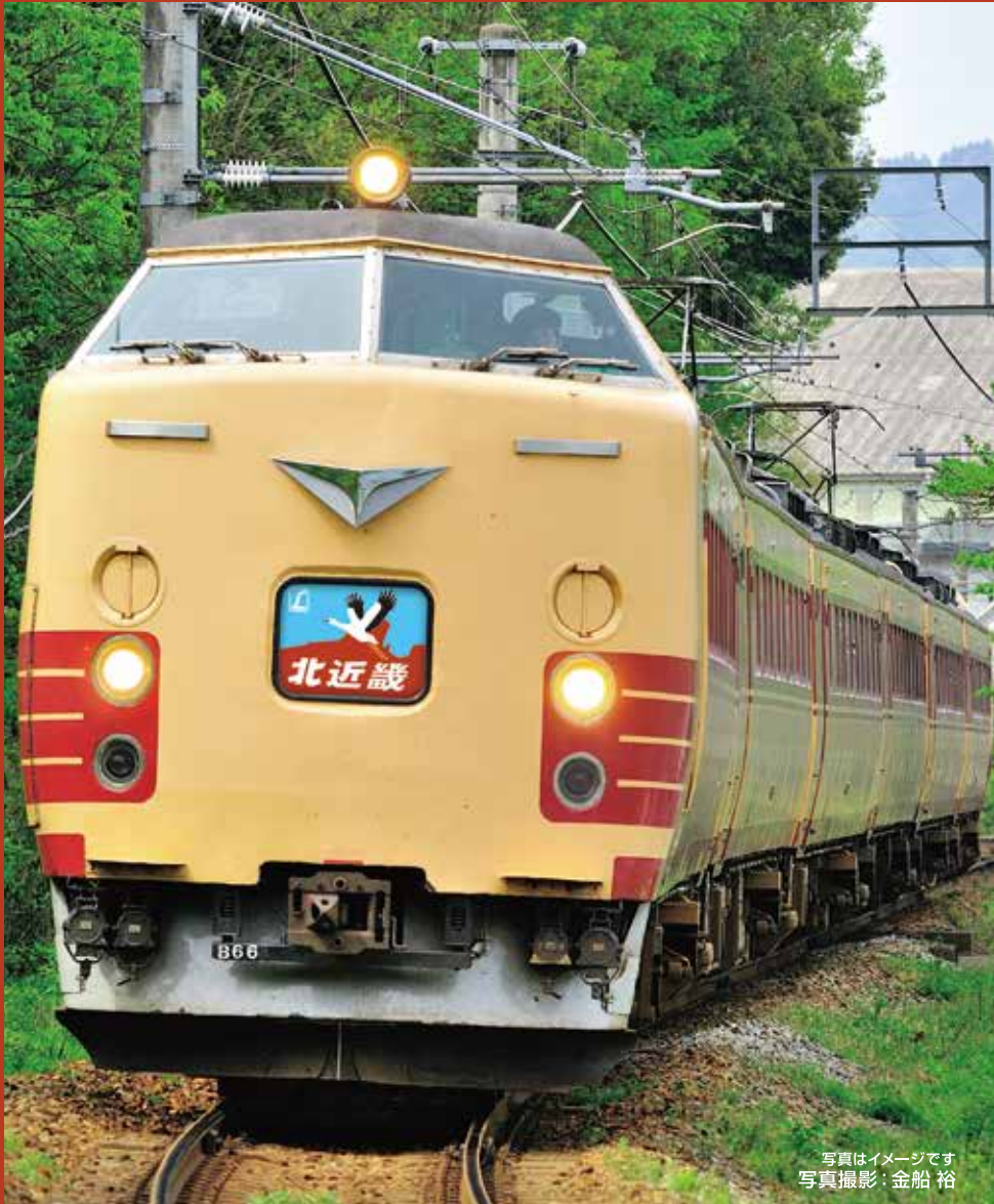
写真はイメージです