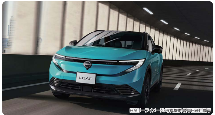
日産リーフイメージ