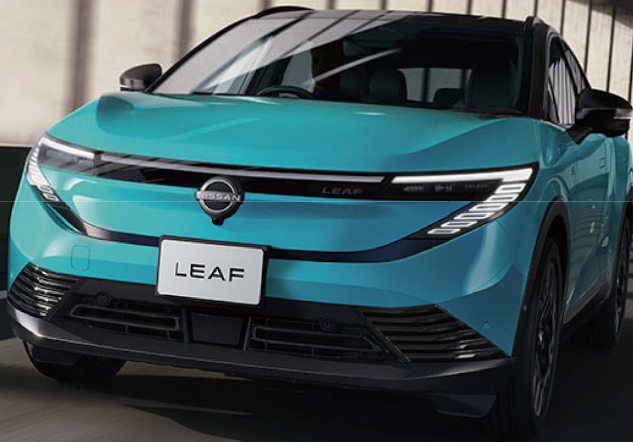
日産リーフイメージ