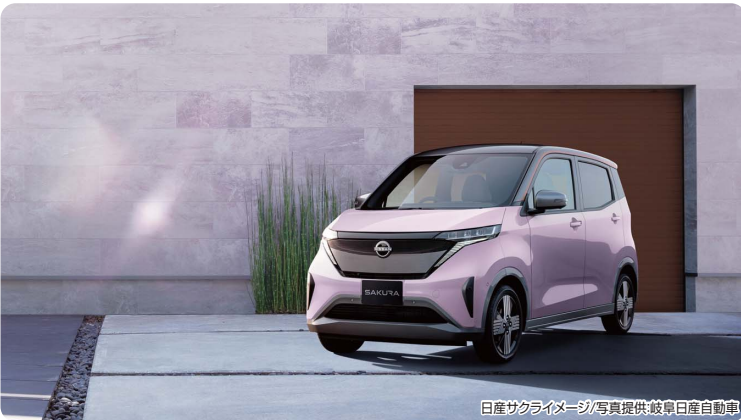
日産サクライメージ

軽自動車なのに4人乗車でも問題なし!力強い加速、滑らかな走り、高い静粛性を兼ね備えるモデルです!お家でカチッと充電するだけ!スタンドに行かなくていい!セカンドシートの足元が広々&フラット!が好評です。日常使用に十分な航続可能距離を確保しています!