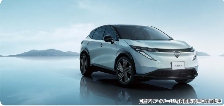
日産アリアイメージ