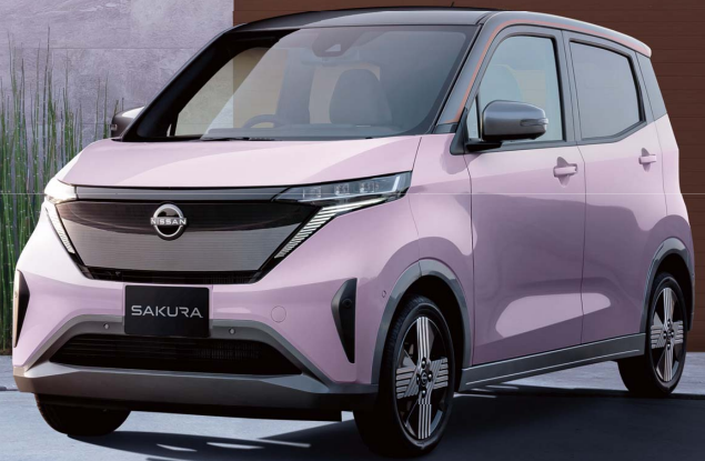
日産サクライメージ