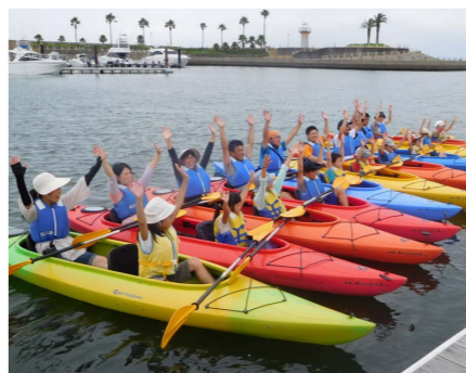
カヤック体験 (イメージ)

JR岐阜駅（7:30発）—岐阜県庁（8:00発）—岐阜羽島駅（8:30発）—三重県・マリナ河芸/干潟の生き物観察/昼食【シーフードカレー】/カヤック体験/ビーチクリーン活動（10:30～15:15）—岐阜羽島駅（17:15着）—岐阜県庁（17:45着）—JR岐阜駅（18:15着）