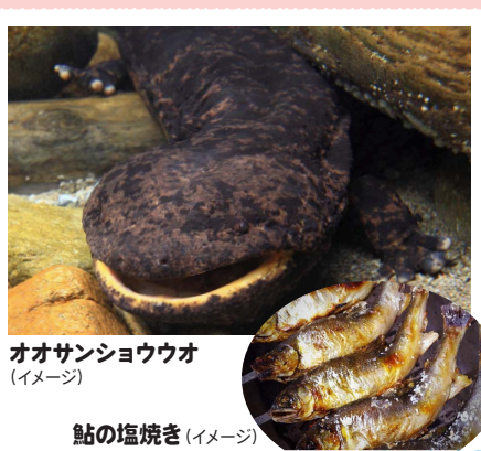
オオサンショウウオ (イメージ)