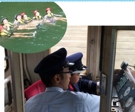
樽見鉄道運転体験 (イメージ)

JR岐阜駅（7:30発）—本巣市・樽見鉄道本巣駅/車両基地見学と運転体験/樽見鉄道乗車体験【本巣駅～樽見駅】（8:15～11:00）—揖斐川町・徳山会館/昼食【ダムカレー】—揖斐川町・生命の水と森の活動センター/プカプカ体験/生き物観察（13:00～16:00）—JR岐阜駅（17:30着）