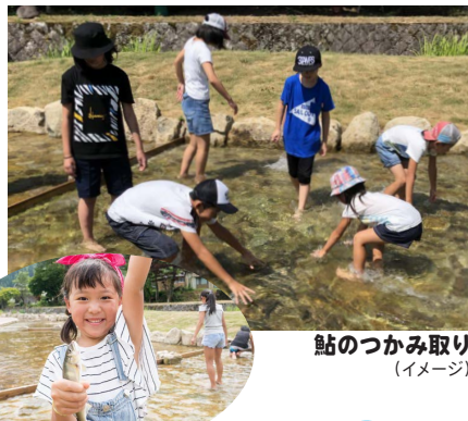
鮎のつかみ取り (イメージ)

JR岐阜駅（7:45発）—中濃総合庁舎（8:30発）—郡上市・長良川あゆパーク/シアター見学《川の生態・鮎の学習》/鮎のつかみ取り/串打ち体験/昼食【飯盒体験：カレー】（9:30～13:30）/林業体験/森のお話/原木切り体験/しいたけの原木づくり（13:30～15:00）—中濃総合庁舎（16:00着）—JR岐阜駅（16:45着）