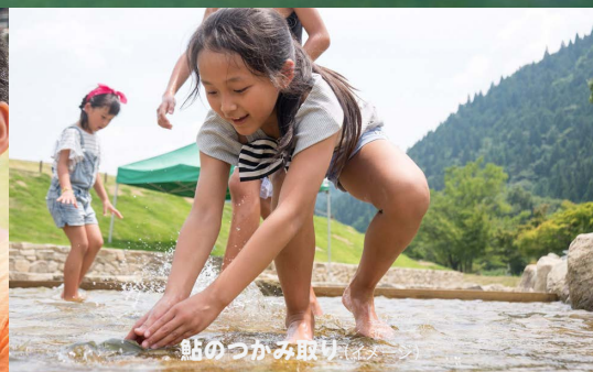
鮎のつかみ取り（イメージ）

全 11 コース（日帰りバスツアー 10 コース、1泊2日バスツアー 1 コース）