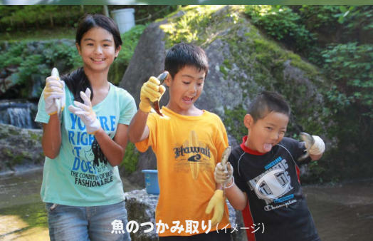
魚のつかみ取り（イメージ）

森・里・川・海での自然体験や保全活動を通じて、 流域の環境について親子で学び・体感するツアーです。