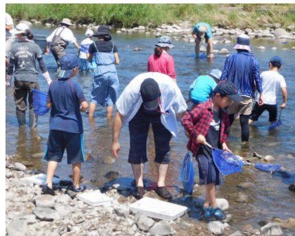
カワゲラウォッチング (イメージ)