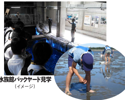
水族館バックヤード見学 (イメージ)

JR岐阜駅（7:30発）—JR大垣駅（8:15発）—名古屋港水族館/バックヤード見学/水族館自由見学（9:30～11:30）—藤前干潟/昼食【地元食材のお弁当】/干潟の生物観察/クリーンアップ活動/漂着ゴミや干潟のお話（12:15～15:30）—JR大垣駅（16:45着）—JR岐阜駅（17:30着）