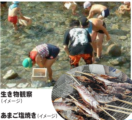
生き物観察 (イメージ)