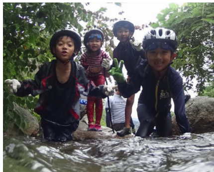
プチシャワークライミング体験 (イメージ)

岐阜県庁（8:00発）—JR大垣駅（8:30発）—揖斐川町・揖斐高原月見リゾート/マスのつかみ取り・マスのツボ抜き/昼食【BBQ】/プチシャワークライミング/昆虫植物採集/ドライフラワーアート作り（10:00～15:30）—JR大垣駅（17:00着）—岐阜県庁（17:30着）