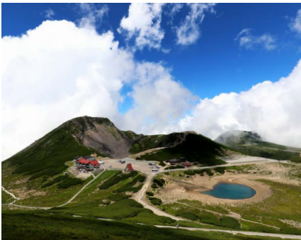
乗鞍畳平（イメージ）