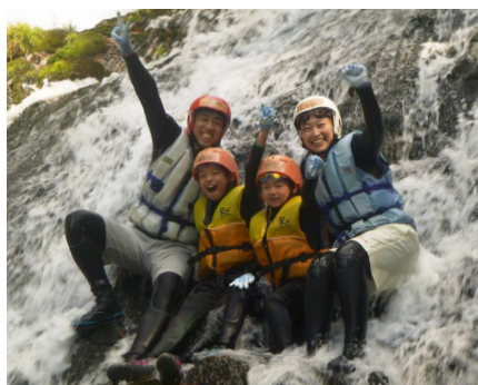
シャワークライミング体験 (イメージ)

JR岐阜駅（7:30発）—中濃総合庁舎（8:15）—郡上市・ひるがの/分水嶺公園ガイドウォーク（9:15～10:15）—高山市・荘川町/昼食【石釜ピザづくり/ダッチオープン料理】（10:30～12:30）—シャワークライミング体験（13:00～16:00）—中濃総合庁舎（17:15着）—JR岐阜駅（18:00着）