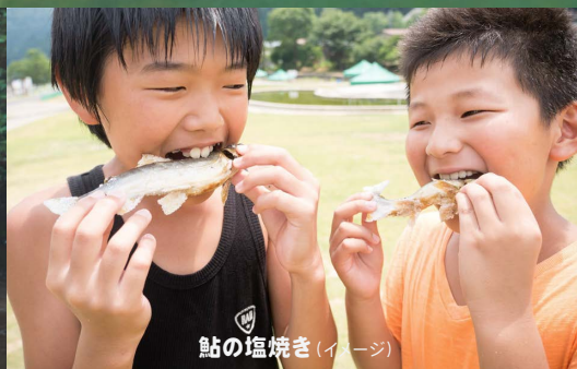
鮎の塩焼き（イメージ）