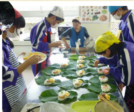
朴葉すしトッピング体験 (イメージ)

JR大垣駅（8:00発）—JR岐阜駅（8:45発）—中津川市・付知福祉センター/昼食【朴葉すしトッピング体験】（10:45～12:15）—中津川市・夕森公園/夕森公園森林散策/マス釣り体験/塩焼き（12:45～15:15）—JR岐阜駅（17:15着）—JR大垣駅（18:00着）