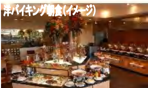
洋バイキング朝食(イメージ)