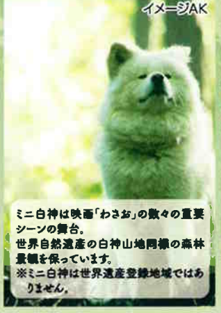
ミニ白神は映画「わさお」の数々の重要シーンの舞台。世界自然遺産の白神山地同様の森林景観を保っています。※ミニ白神は世界遺産登録地域ではありません。