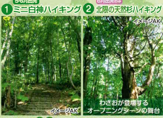
6月出発は①②より現地でもどちらかをお選び下さい。(5月出発は①のみの限定となり、選べません。)