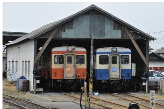
撮影会を実施する那珂湊駅

ひたちなか海浜鉄道を走る車両は、8両のうち5両が廃止になった私鉄や第3セクターで活躍していたもの。バラエティに富む車両と風光明媚な景色を目的に、全国から訪れる鉄道ファンによる運賃や物販収入も会社運営の基盤となっています。今回は、6月25日の運転再開一番列車に乗車。同時に、運行開始前の車両の清掃を行う、運行再開の支援ツアーを企画しました。この企画は、1人でも多くの方に鉄道乗って頂き、また記念品等を買って頂き、ひたちなか鉄道の収入アップを図る事により、再開に協力したいと言う、当社の申し入れを鉄道が受け入れて頂き実現したものです。詳細は、以下の通りです。