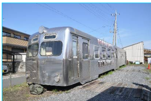
保存されているケハ601