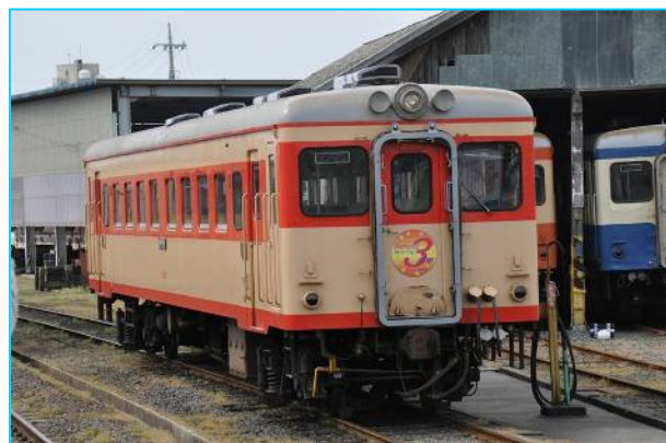
ひたちなか海浜鉄道 キハ 2005