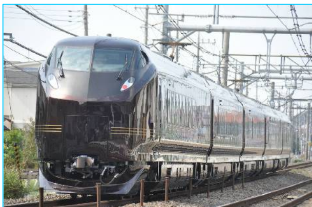
JR東日本 E655系 「なごみ」