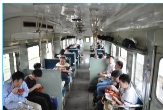
あんこう鍋は、専用車両内でもお召し上がり頂けます。（写真は、別ツアー時のもの）