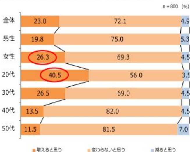
表10：今後、日本酒を飲む量は増えると思いますか？

今後の日本酒の飲用量について聞いたところ、「増える」と回答した人は全体では23.0%ですが、女性で26.3%と男性を上回っており、年代別でも若い世代ほど「増える」と回答する人の割合が高いという傾向が見られました。海外に向けた日本酒の輸出量は年々増加していますが、その背景には世界的な和食ブームの広がりがあります。和食の世界無形文化遺産登録に向けた動きもある中、今後は国内外問わず日本の食文化の一つである日本酒にさらなる注目が集まることが期待されます。