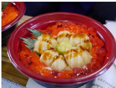
▲地元洋菓子店作、海鮮丼に模した「スイーツ丼」