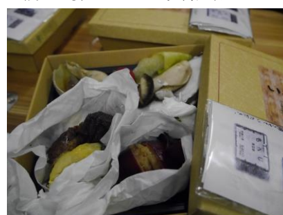
▲海鮮バーベキューは車内でご賞味

添付の写真は転用可能です。JPEGが必要な場合は、ご連絡ください。 各ツアーのパンフレットやニュースリリースもあります。必要な場合は、ご連絡ください。