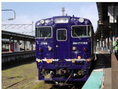
▲「ながまれ海峡号」函館駅を出発