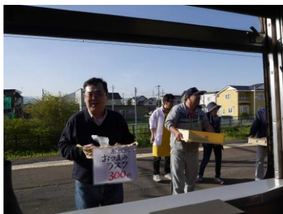
▲上磯駅ホーム。地元産品の販売