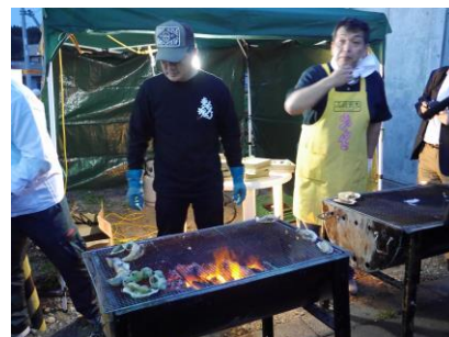
▲茂辺地駅ホームでは地元海産物のバーベキュー