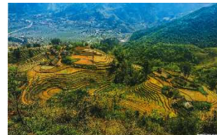
美しいライステラスと少数民族の町サパ&ハノイ 5日 ビクトリアエクスプレスで寝台列車の旅

＜旅行代金 エコミークラス 193,900円～ ビジネスクラス 294,900円～＞ ベトナムでは ビクトリア・エクスプレスの寝台列車の旅 をお楽しみいただけます。 絶景ポイントはサパの棚田ハイキングです。 サパは人気のビクトリア・サパ・リゾート&SPAに宿泊します。