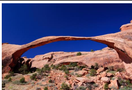
<アーチーズ国立公園>