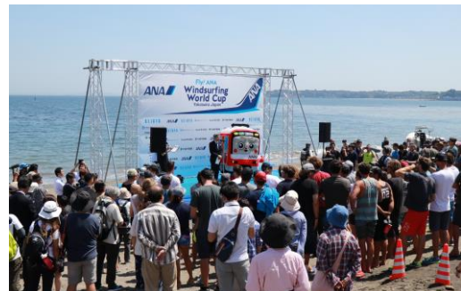
ウインドサーフィンW杯の様子