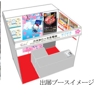
出展ブースイメージ