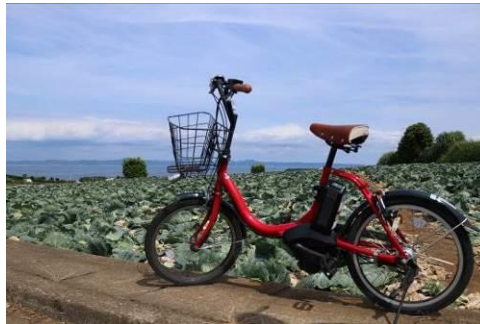
みうらレンタサイクル

京急電鉄、日本旅行が連携し、地元自治体の協力をいただき、地域の観光資源の発信や地域への誘客に取り組めます。具体的には、マリンスポーツ、サイクリング、乗馬等の地元の観光資源を生かしたツアーの造成や販売の協力を行います。