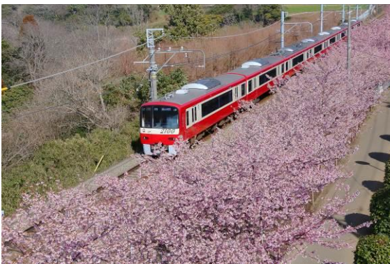
2月に三浦海岸駅周辺で満開をむかえる河津桜