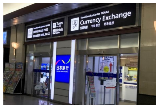
日本旅行 TiS 大阪インバウンド カウンター (TIC)