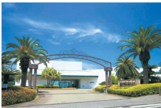
観音崎京急ホテル

三浦半島エリアの宿泊施設や農業・漁業等の地元産業を活用した新たな体験商品を含んだツアーの造成・販売や、瀬戸内や北陸等の西日本エリアの魅力が詰まった商品をさらに磨き上げ、広告宣伝販売促進により送客に努めます。