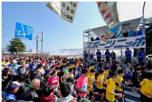
三浦マラソンの様子

三浦マラソンやウインドサーフィンW杯等既存イベントの情報を日本旅行の国内外のネットワークに配信することに加え、国内外の企業・団体等へのスポーツイベントの実施を提案し、誘客拡大を図ります。また、横浜等でのMICEについても、積極的な誘客を推進します。