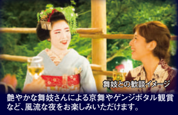
舞妓との歓談イメージ 艶やかな舞妓さんによる京舞やゲンジボタル観賞など、風流な夜をお楽しみいただけます。