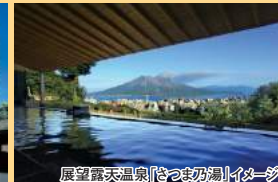
展望露天温泉「つつまの湯」イメージ