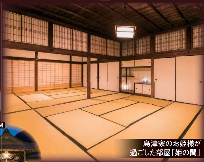
島津家のお姫様が 過ごした部屋「姫の間」

江戸時代末期に薩摩藩で作られたカットグラスで、鹿児島 の伝統工芸品。切子面に生まれる色のグラデーション、 その美しいぼかしが特徴です。