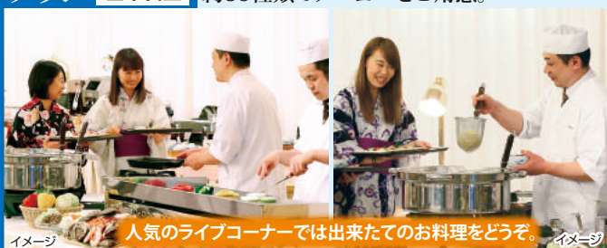
人気のライブコーナーでは出来たてのお料理をどうぞ。

多彩なメニューが楽しめるバイキング料理。和歌山ラーメンや新鮮な海鮮鉄板焼きなど約35種類のメニューをご用意。