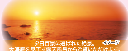
夕日百景に選ばれた絶景。イマージュ大海岸を見下す露天風呂からご覧いただけます。