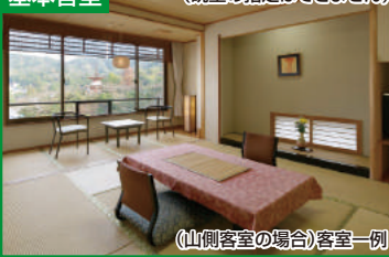
(山側客室の場合)客室一例