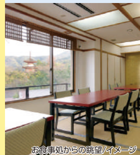
お食事処からの眺望イメージ

イス・テーブル席のお食事です。お食事処からはライトアップされた大鳥居がご覧いただけます。