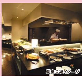
朝食会場イメージ

食事処「旬の丸」で 秋の恵みたっぷりの 「60品目以上」の バイキング。 卵料理や萩の 地元料理など、 料理人がその場で 提供します。