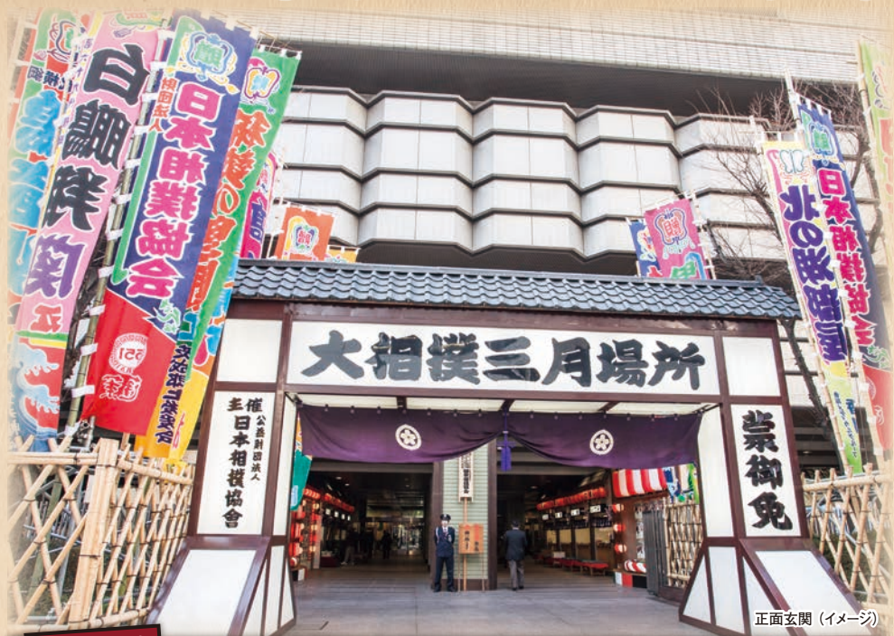
正面玄関 (イメージ)