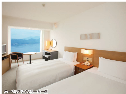
スーパリアツインルーム例

■旅行代金(おとなおひとり様) (JRセットプラン) 博多発着・こだま・ひかり(限定列車) 普通車指定席利用おとなおひとり様1泊2日食事なし