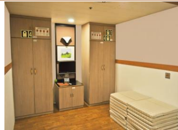
イメージ: 船内客室/スタンダードA