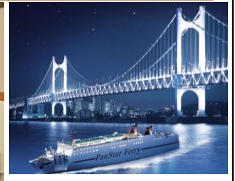
イメージ: パンスターフェリー外観