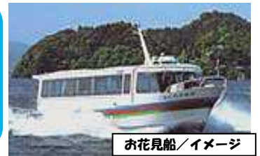
お花見船/イメージ

琵琶湖八景「暁霧・海津大崎の岩礁」としても知られる景勝地で、びわ湖随一の岩礁と、湖の碧、遠くに望む竹生島、その景色のコントラストは美しく、毎年多くの花見客で賑わいます。