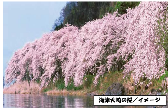
海津大崎の桜/イメージ

■マークの見方: ==貸切バス ~船 ◎入場観光 ●下車観光 ■最少催行人員:各日25名様 ■添乗員:全行程同行いたします。■食事条件:朝0回・昼1回・夕0回 ■全行程貸切バスを利用いたします。【新大阪発着バスツアー主要取引バス会社】※すべて公益社団法人日本バス協会加盟のバス会社となります。 西日本JRバスサービス/阪急観光バス/ヤサカ観光バス/日本交通バス/両備バス/帝産観光バス/国際興業大阪バス/近鉄バス/大阪バス近畿/商都交通バス/奈良観光バス ※告知日には満席となっている場合がございます。予めご了承ください。 ※お客様の安全の為、車中は必ずシートベルトを着用ください。 ※当日の天候・交通状況により、表記の行程の到着時刻・出発時刻・滞在時間を変更することがございます。