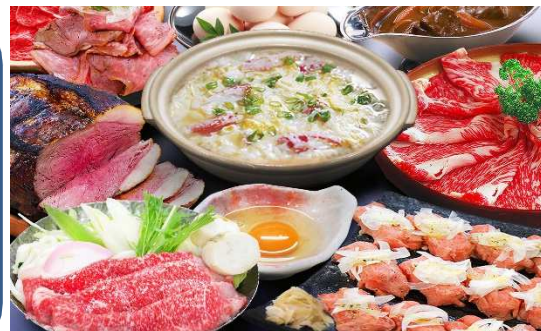
ご昼食(写真はカニ雑炊です。)/イメージ