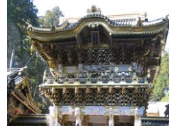
日光東照宮:イメージ