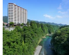
ホテル外観:イメージ