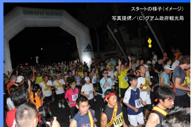
スタートの様子(イメージ)