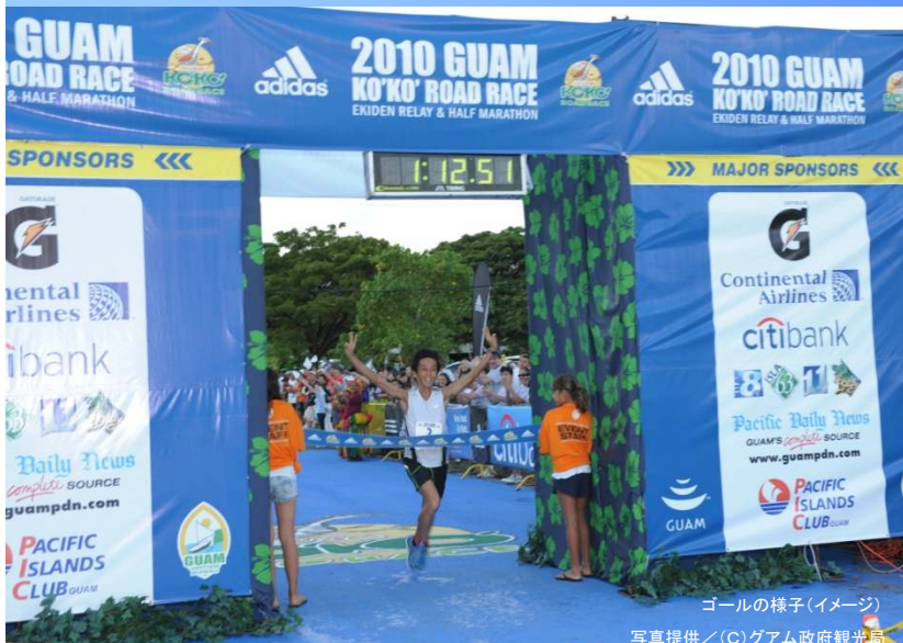
ゴールの様子(イメージ)

第6回グアム ココロードレースは、グアム政府観光局主催のロードレースで、グアムの島「ココ(Ko'Ko')・バード」に由来して名づけられ、ハーフマラソンと、4人で21.0975kmを走る駅伝が同時開催されるユニークなレースです。