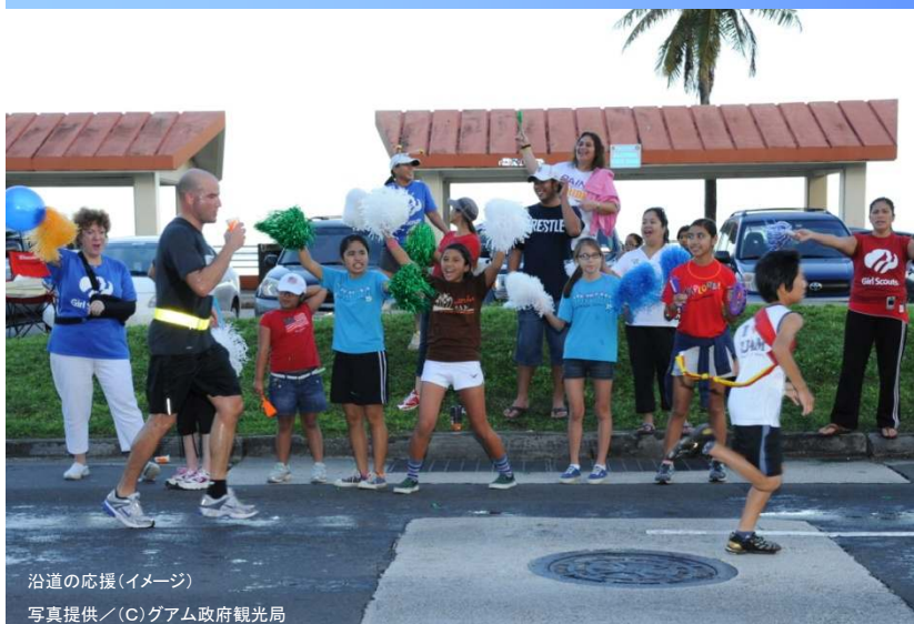
沿道の応援(イメージ)