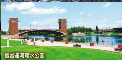
富岩運河環水公園