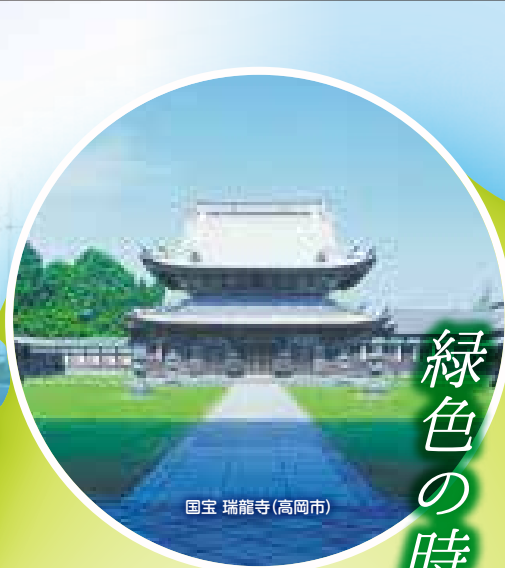
国宝 瑞龍寺(高岡市)