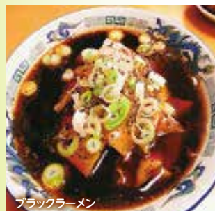
ブラックラーメン