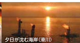
夕日が沈む海岸(滑川)