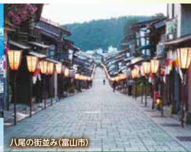
八尾の街並み(富山市)