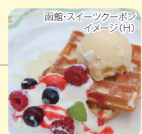
函館・スイーツクーポンイメージ(H)

★人気観光スポット巡りや、北海道ならではの体験など、女性が喜ぶ好きなものを女性社員が実際に体験してご紹介! さらに嬉しいスイーツクーポン付!!