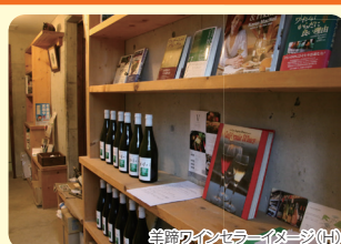
羊蹄ワインセラーイメージ(H)

ワイン用の葡萄を有機栽培している羊蹄ワインセラーの見学をはじめ、小樽運河やガラスのお店、スイーツやお寿司屋さんなど見どころ盛りだくさんです。