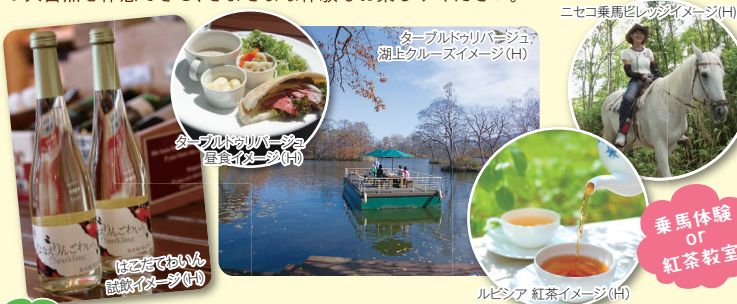
ニセコ乗馬ビレッジのイメージ(H)

種類豊富な「はこだてわいん」の試飲を楽しんだ後は、優雅なクルーズランチを♪ 北海道の大自然を体感できる、さまざまな体験もお楽しみください。