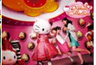
ハローキティのリボン・コレクション™