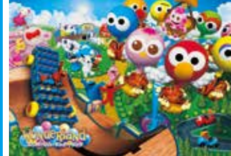
ユニバーサル・ワンダーランド™

世界イチの親子になろう。大人も子供も楽しめる数々のライド・アトラクションや、エルモやスニーピーたちと触れ合えるストリート・ショーなど、ハラエティ豊かなエンターテインメントに、親子の「よききり」は「はっちゃん笑顔」が増えます!