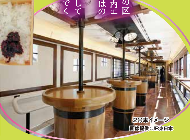
2号車イメージ