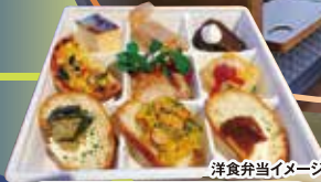
洋食弁当イメージ 軽食/B・C・D・E・F・Gコース (長岡駅～あつみ温泉駅)