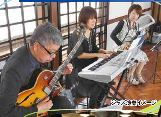
ジャズ演奏イメージ