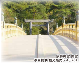
伊勢神宮 内宮

古来より「お伊勢さん」の名で親しまれる日本人の心のふるさと。内宮と外宮を中心に今なお太古の趣を残しています。今年は20年に一度の式年遷宮が斎行されました。