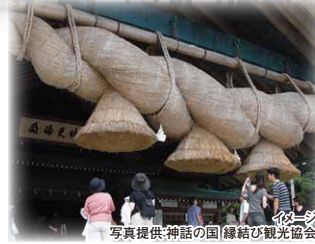
出雲大社 本殿

縁結びの神として親しまれている大国主神を御祭神とする全国的にも有名な出雲大社。現在、60年ぶりの御修造「平成の大遷宮」が斎行されました。