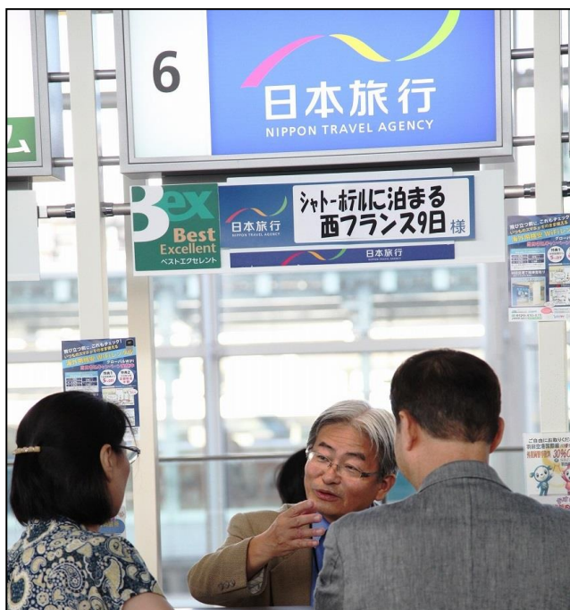
(空港にてお客様へ説明)