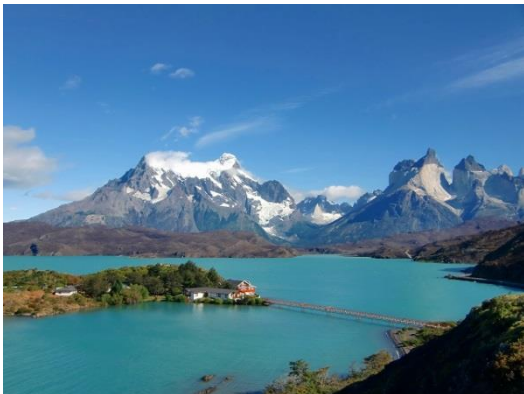
パイネ国立公園(ペオエ湖)

正式名称は「トーレス・デル・パイネ国立公園」と言い、公園名にもなっている象徴「トーレス・デル・パイネ」をはじめ、氷河、湖、滝、豊かな動植物などの大自然が広がっています。