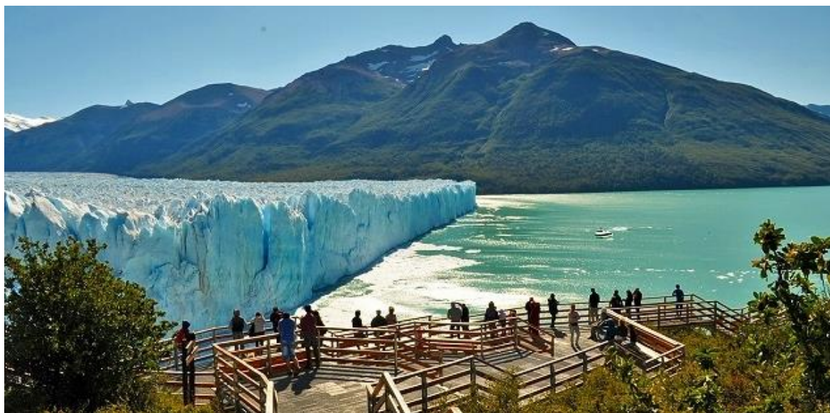
ロス・グラシアレス国立公園（ペリト・モレノ氷河）

当ツアーではタヒチ～パタゴニア間をエア タヒチ ヌイのチャーター便でつなぐことにより、通常 37～40 時間かかる所要時間が約 22 時間 20 分に短縮され、乗り継ぎもタヒチのパペーテでの 1 回のみとなり、パタゴニアがぐっと身近になりました。また、3 月はパタゴニア観光のベストシーズンでもあり、見たことのないダイナミックな自然の営みをたっぷりご堪能いただくことができます。