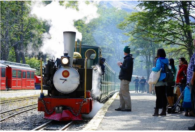
ウシュアイア(世界の果て号)