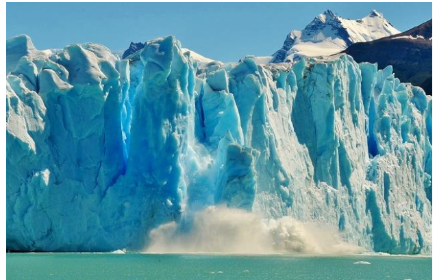
ロス・グラシアレス国立公園(ペリト・モレノ氷河)

南極、グリーンランドに次ぐ氷河面積があり、動きが活発なことで知られます。1981年に世界自然遺産に登録されました。人気のスポット「ペリト・モレノ氷河」は展望台から近くで見ることができ、比較的高い水温のため崩落が見られることもあります。展望台のほか、遊覧船で水上からご覧いただけます。