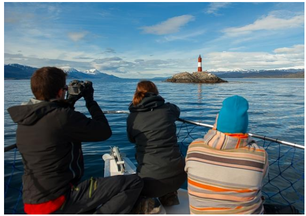
ウシュアイア(ビーグル水道クルーズ)