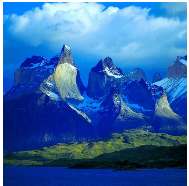
パイネ国立公園(トーレス・デル・パイネ)