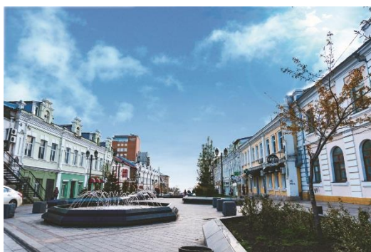
別名「噴水通り」とも呼ばれているフォークナー通り

日本のエアラインとしては初めて、ANAが来年3月より、JALが夏期ダイヤより、成田空港＝ウラジオストク線に新規就航を予定しており、今後のさらなる旅行需要が予想されます。当社ではこれらの新規就航に先駆けて、今年6月にウラジオストクの現地視察を行い、北海道の旅行会社としては初めて、ウラル航空直行便を利用したウラジオストクツアーを企画・発売しました。ウラジオストク市内観光にご案内するほか、マイリンスキー劇場のバレエ・オペラのチケット予約代行も承ります（要別途料金）。現地では日本語を話す係員がご案内しますので、初めての方にも安心してご参加いただける商品となっています。