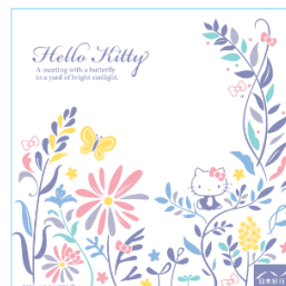
＜ハローキティ ガーゼ風タオル＞