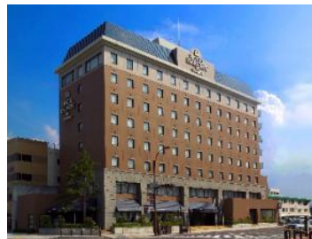
ホテルハーベストイン米子