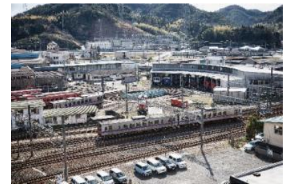
部屋からの眺望（イメージ）