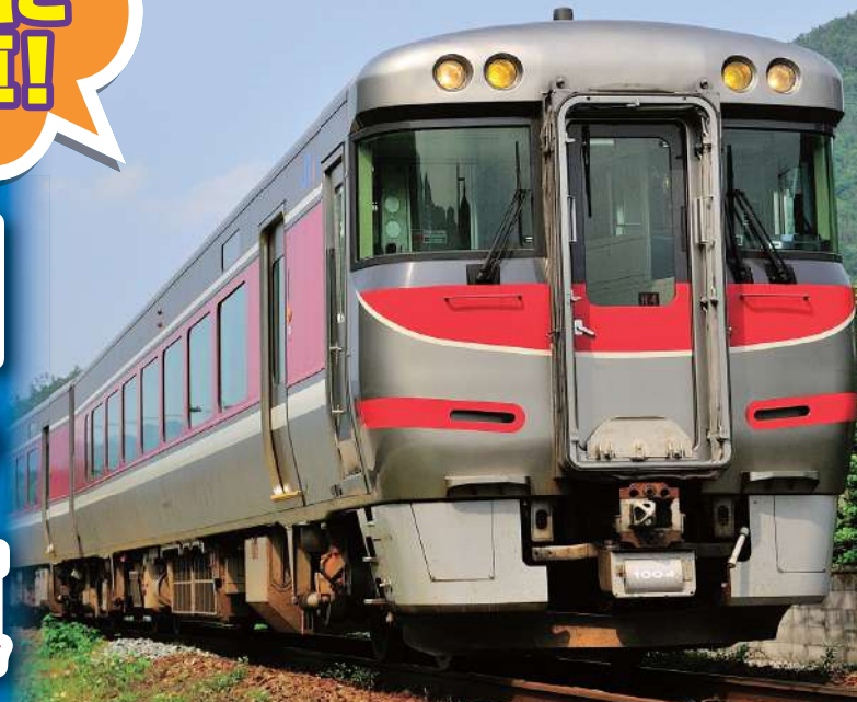
キハ189系外観 イメージ