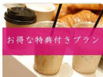
お得な特典付きプラン