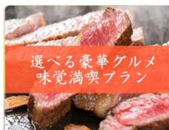
選べる豪華グルメ 味覚満喫プラン