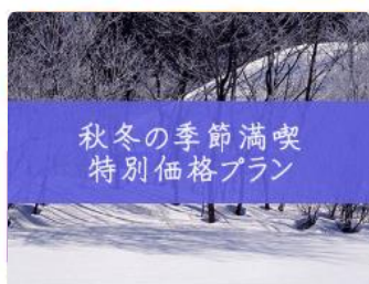
秋冬の季節満喫 特別価格プラン