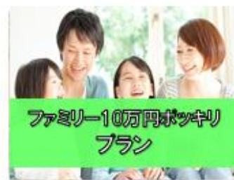
ファミリー10万円ポッキリ プラン