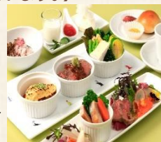
洋食コース (イメージ)