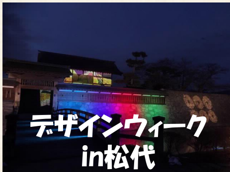
(松代城跡イメージ)