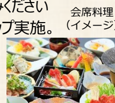
会席料理 (イメージ)