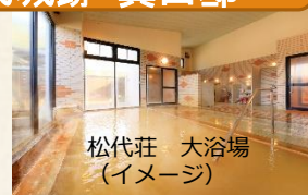
松代荘 大浴場 (イメージ)