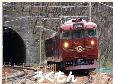
(ろくもん車両イメージ)