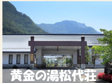
(黄金の湯松代荘外観イメージ)