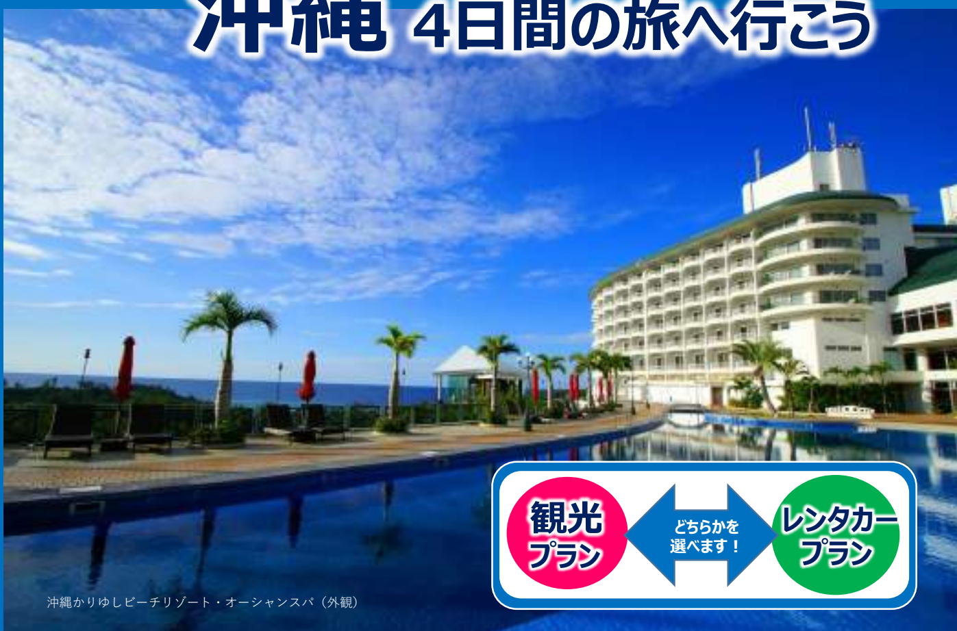
沖縄かりゆしビーチリゾート・オーシャンスパ（外観）