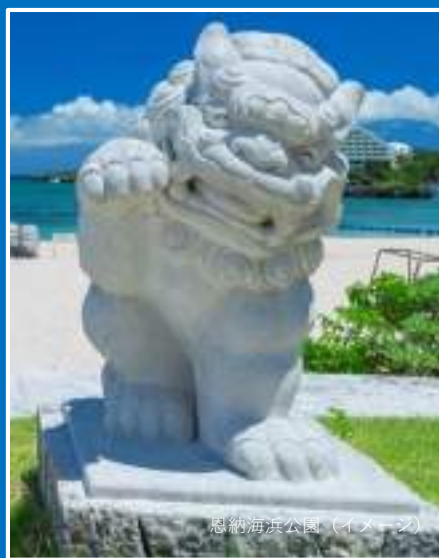
恩納海浜公園（イメージ）