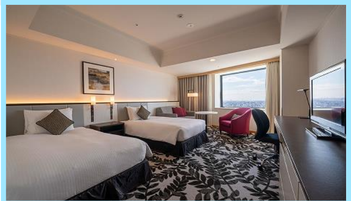
デラックスツインイメージ