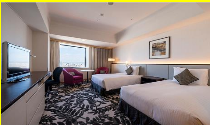
スタンダードツインイメージ

■旅行代金(おひとり様)／3名1室利用の場合 1泊2日朝食+大須食べ歩きクーポン付の場合