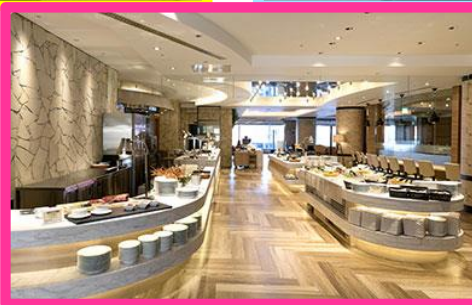
レストランイメージ