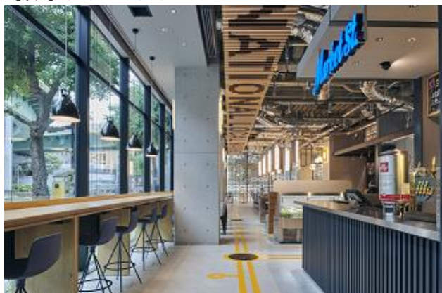
レストランイメージ

名古屋で一番元気の商店街 「大須」の食べ歩きクーポン付! タピオカジュースやからあげ・一口うどんなど、 5枚綴りのクーポンから自由に選べます! ※お一人様1枚 ※クーポンは、ホテルのフロントでお渡しいたします。