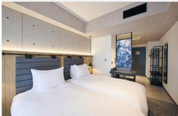
【禁煙】スタンダードツインイメージ

■旅行代金(おひとり様)／ダブル2名1室利用の場合 1泊2日朝食+大須食べ歩きクーポン付の場合