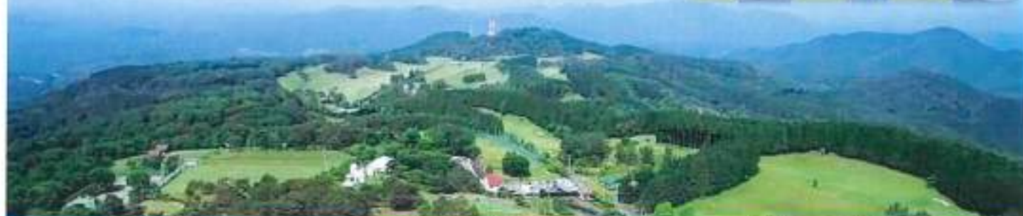
紙ヒコーキタワー