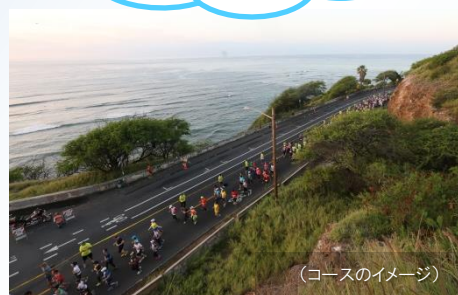
(コースのイメージ)