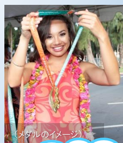
(メダルのイメージ)