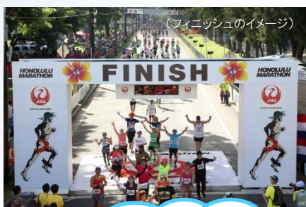
(フィニッシュのイメージ)