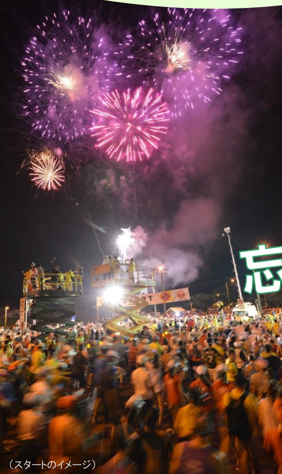
(スタートのイメージ)