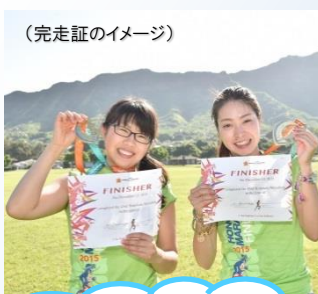
(完走証のイメージ)