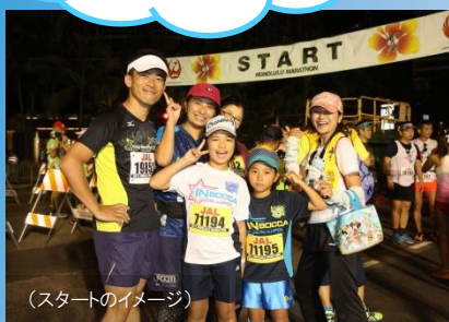
(スタートのイメージ)

夜が明ける頃、朝日と共に 美しい海岸線がみえてきます。 ホノルルに来て良かった～