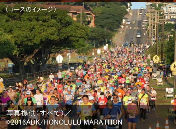
(コースのイメージ)