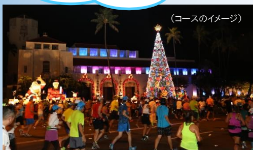
(コースのイメージ)