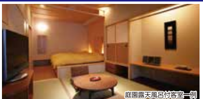
庭園露天風呂付客室一例